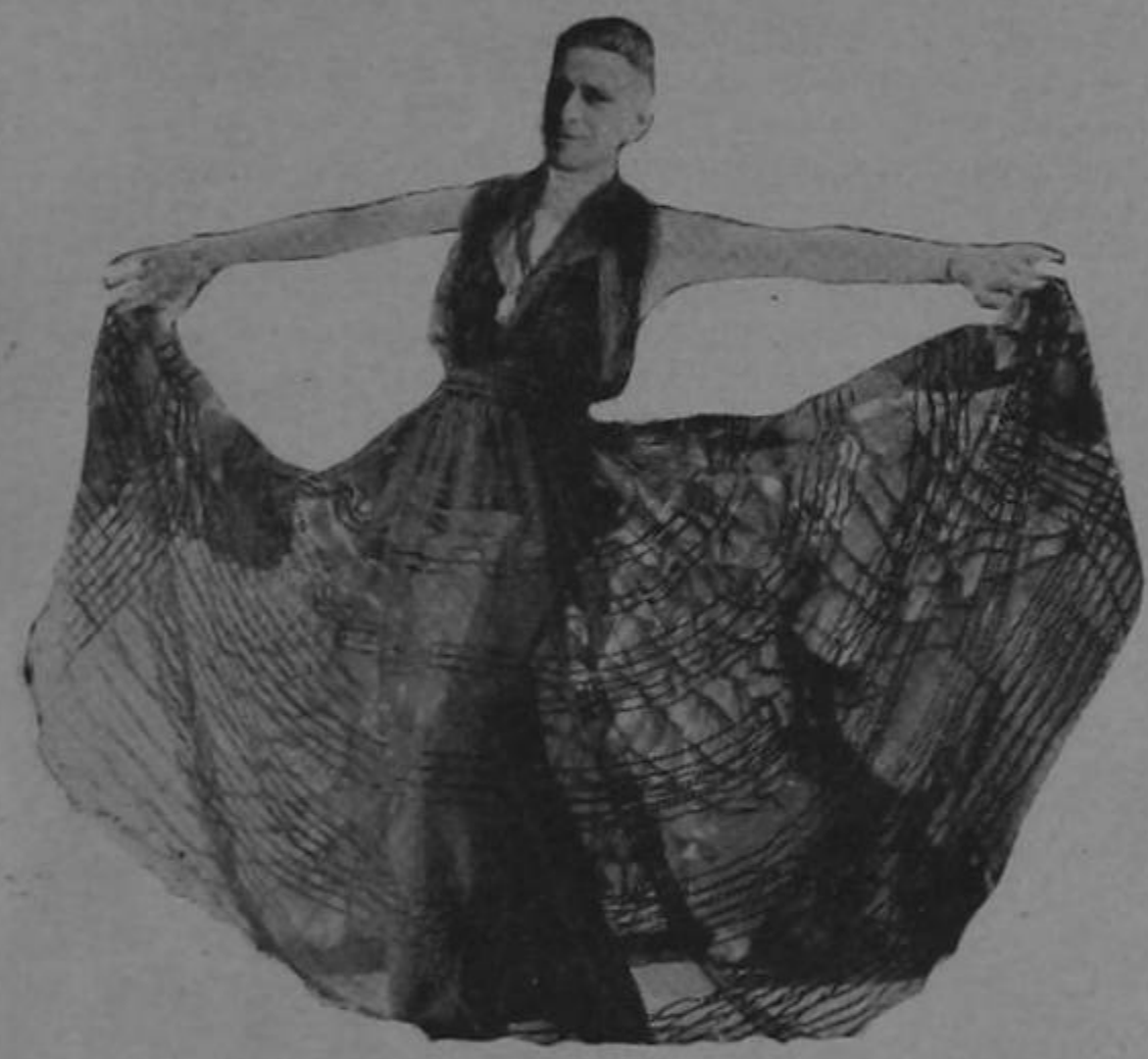
Don Otilio Ulate posando para LA SEMANA COMICA (Experto en levantar faldas)